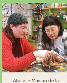
Atelier - Maison de la Culture et du Pic Champlain