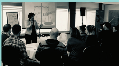
Projet Agroleader : Nourrir ensemble l'agriculture durable.

La Shère • Mitis Lab • TERFA • CPE les petites étoiles magiques (Saint-Anaclet) • Élyme Conseils (Agroleader) • Exposition agricole