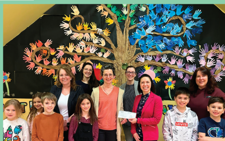
Prix Fondation Desjardins

Vieux Théâtre de Saint-Fabien • École Paul-Hubert • École des Merisiers (Sainte-Blandine) • École Bois-et-Marées (Sainte-Luce) • École de l'Écho-des-Montagnes (Saint-Fabien) • École Le Mistral • Fondation Cégep de Rimouski • Pro-Jeune-Est • Carrefour jeunesse emploi Mitis • CLAC ( La crue des mots) • CIBES (Carrefour international Bas-Laurentien pour l'engagement social) • Expo-sciences