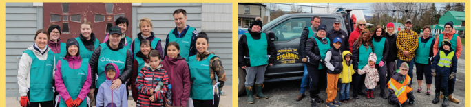
Corvée de nettoyage - Saint-Gabriel et Saint-Donat