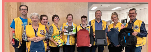
Club Lions Sainte-Blandine - Projet Crayon et Baluchon

Club Lions (Saint-Anaclet, Sainte-Blandine, Bic) • Fondation du Centre hospitalier régional • Fondation Maison Marie-Élisabeth • Club des 50 ans et plus (Bic, Saint-Narcisse, Saint-Valérien, St-Charles Garnier) • Centraide BSL • Corporation des sports et loisirs de Saint-Valérien • Maison des Familles de La Mitis • Cercle des Fermières de Sainte-Luce