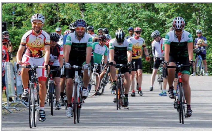
Défi Vélo Desjardins

De nombreuses activités ont eu lieu en cours d'année, soit en partenariat avec d'autres organismes, des régions ou avec des composantes du Mouvement Desjardins.