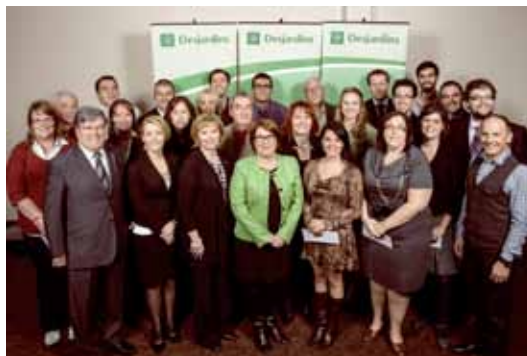
La Fondation Desjardins remet 32 500 $ en bourses d'études dans la région des Cantons-de-l'Est.

Preuve de son rayonnement croissant et de l'efficacité de son nouveau formulaire d'application en ligne, la Fondation a vu son nombre de candidatures plus que doubler en 2012. Au final, ce sont 365 bourses d'études et prix qui ont été remis cette année. De ce nombre, 84 bourses ont été accordées dans le secteur de la finance, 145 dans le programme expertises et savoirs, 94 dans le programme carrières Desjardins, 31 dans celui de la coopération et de la démocratie et 11 pour encourager la persévérance scolaire.