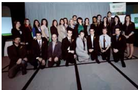
Hommage aux boursiers nationaux dans le cadre du Rendez-vous du Savoir tenu le 15 novembre 2012 au Palais des congrès de Montréal.

Les boursiers en compagnie des dirigeants et gestionnaires de leur caisse.