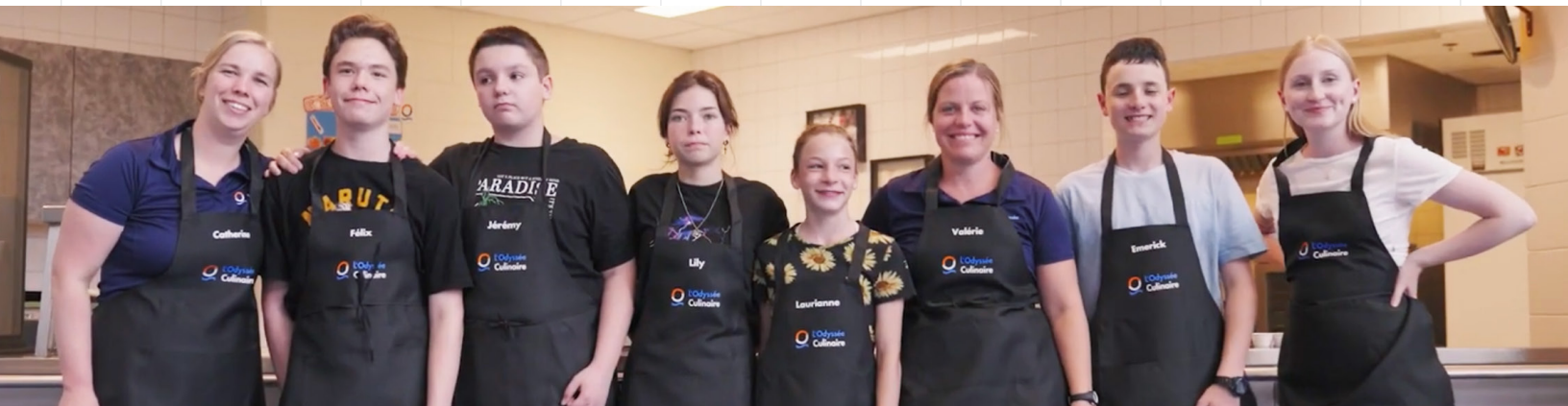
Quelques-uns des jeunes cuisiniers qui ont participé à l'Odyssee culinaire, à Val Béclair.

Cette année, c'est 626 initiatives qui ont pu prendre leur envol, au bénéfice de plus de 115 500 jeunes! Un appui totalisant 1,7 M$. Retour sur trois projets réalisés en 2023 qui ont eu des retombées concrètes dans la communauté.