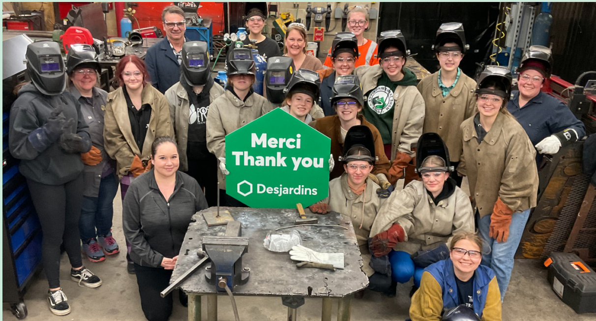
Des étudiantes du programme de métiers de l'école secondaire du district Lively, à Sudbury, ont reçu un appui de Desjardins.