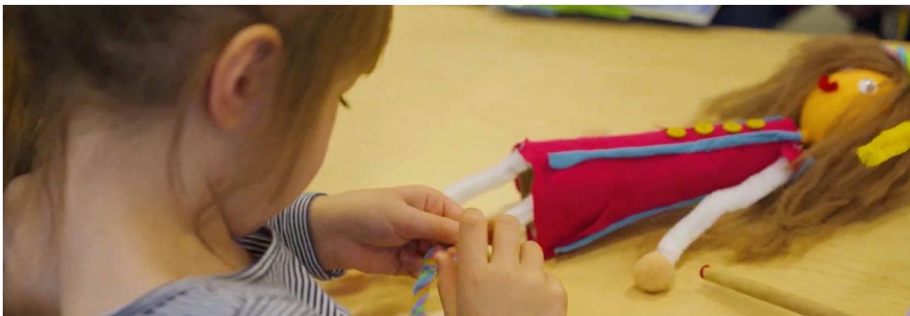
Des élèves de l'école Pierre-de-Coubertin ont pu monter un spectacle de marionnettes grâce aux Prix Fondation Desjardins.