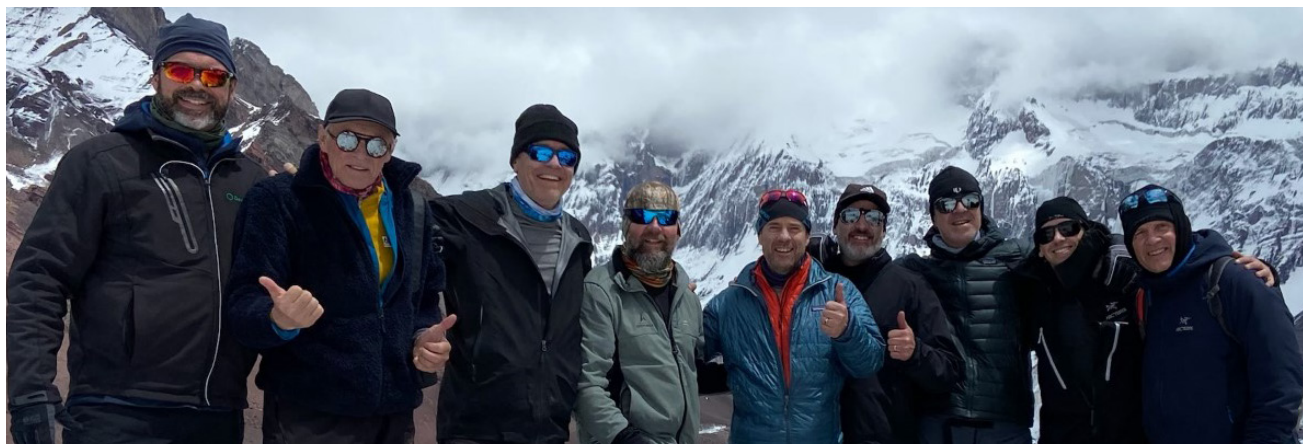
Un groupe d'employés et de retraités de Desjardins ont repoussé leurs limites pour atteindre le sommet de l'Aconcagua.