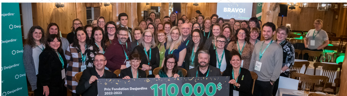
Un événement de reconnaissance des caisses de Rouville et du Haut-Richelieu pour célébrer la remise de 43 Prix Fondation Desjardins.

Ces prix permettent de bonifier le nombre de projets retenus dans cette région. En 2023, par le biais de la Fondation Desjardins et des caisses, un montant de 235 000 $ a été remis à 91 écoles et organismes de la région de Granby.