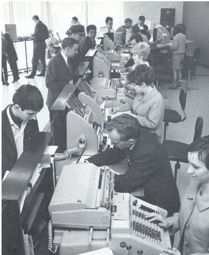
Vue intérieure de la Caisse Desjardins à L'Exposition Universelle de Montréal