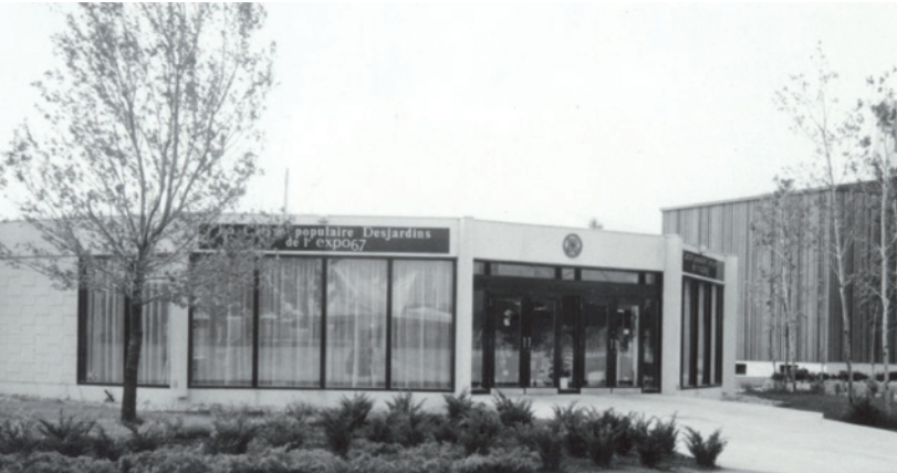
Caisse Desjardins à L'Exposition Universelle de Montréal